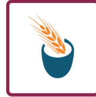
Segurança alimentar local