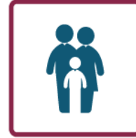
Desenvolvimento Rural & Social