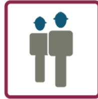
Direitos humanos e trabalhistas