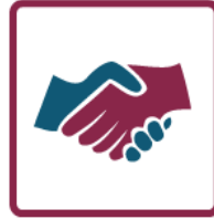
Direitos da terra